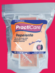
STAND UP POUCH

Por más de 10 años nos hemos dedicado a brindar soluciones en presentación de toallitas húmedas a las empresas o comerciantes que desean proporcionar una novedosa y atractiva alternativa de limpieza e higiene en pro de la salud.